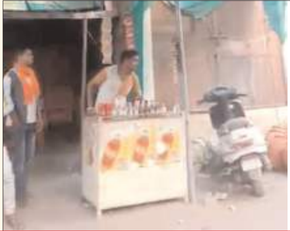
आजाद की नगरी में पुलिस ने खुले काउंटर पर अवैध शराब की बोतले जमाकर बेचने की दे रक्खी इस तरह से खुले आम आजादी