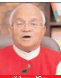
-डॉ. वेदप्रताप वैदिक

विभिन्न अध्ययनों से यह पुष्टि हो चुकी है कि वायु प्रदूषण अब किडनी के लिए भी बड़ा खतरा बनने लगा है। दरअसल दूषित वायु में पीएम 2.5 के अलावा शीशा, पारा और कैडमियम जैसे भारी तत्व भी मौजूद होते हैं, जो धीरे-धीरे किडनी को खराब करते हैं। प्रदूषण के कारण शरीर में होने वाली ऑक्सीजन की कमी से किडनीयों की कार्यक्षमता बाधित होती है। प्रदूषित माहौल में ज्यादा समय बिताने वाले लोगों की किडनियां रक्त को सही तरीके से