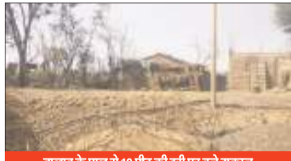
तालाब के पाल से 10 फीट की दूरी पर बने मकान