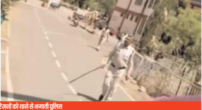
लट्टु लेकर पिडित परिजनों को थाने से गनाती पुलिस