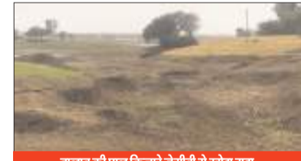
तालाब की पाल किनारे जेसीबी से खोदा गड्ढा