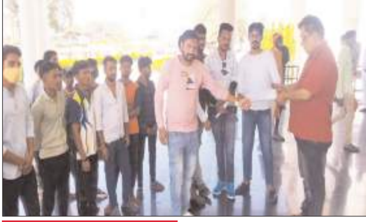
बेरोजगार युवाओं द्वारा जापान में रखी यह मांग

मध्य प्रदेश प्रोफेशनल एग्जामिनेशन बोर्ड एक बार फिर विवादों के घेरे में है। दरअसल पिछले दिनों मध्य प्रदेश कॉस्टेबल पात्रता परीक्षा 2020 आयोजित की गई थी, जिसका परीक्षा परिणाम दिनांक 24 मार्च 2022 को घोषित किया गया। जिसको लेकर कई अभ्यर्थियों ने सवाल खड़े किए हैं। अभ्यर्थियों का कहना है कि, पीईबी द्वारा उनका रिजल्ट दो बार घोषित किया गया। जिसमें उन्हें पहले कालीफर्मा बताया गया और कुछ ही समय बाद उन्हें उनको नॉट कालीफर्मा करार दिया गया। साथ ही हाल ही के दिनों में मध्य प्रदेश शिक्षक पात्रता परीक्षा वर्ग-3 आयोजित की गई थी, जिसमें दिनांक 27 मार्च के पेपर का स्क्रीनशॉट सोशल मीडिया पर वायरल हुआ था, जिसको लेकर भी अभ्यर्थियों ने कहा कि, पेपर लीक होना हम युवाओं के साथ खिलवाड़ है। इस प्रकार के खिलवाड़ को हम सहन नहीं करेंगे। ध्यान रहे 2020 में कृषि विस्तारक अधिकारी की परीक्षा परिणाम में भी जटिलता सामने आई थी।