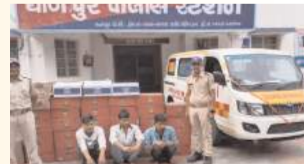
गानरा से पहूची बरझार और बरझार से एम्बुलेस से पहूचे गुजरात के धानपुर में शराब