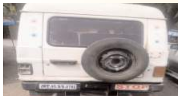
शराब माफिया के गुर्गों डो रहे ये सोड़वा क्षेत्र में अवैध शराब के उक्त वाहन ने ले ली जान

झाबुआ एवं अलीराजपुर जिले से गई शराब को जप्त करने में पुलिस सफ्त हुई पुलिस के संरक्षण के साथ लालच में आकर चंद्रशेखर आजाद नगर से बरझार पहुँची अवैध शराब बरझार के प्रार्थमिक स्वास्थ्य केंद्र की एंबुलेस में शराब गुजरात में डोईं जा रही थी कि, गुजरात के धानपुर पुलिस ने एंबुलेस में मय शराब के तीन आरोपी के साथ एंबुलेस को जप्त किया। गुजरात पुलिस चाहे तो शराब की बोतलों के बेच नंबर के आधार पर जांच करती है तो यह खुलासा हो जाएगा कि आजाद नगर की शराब दुकान से उक्त शराब