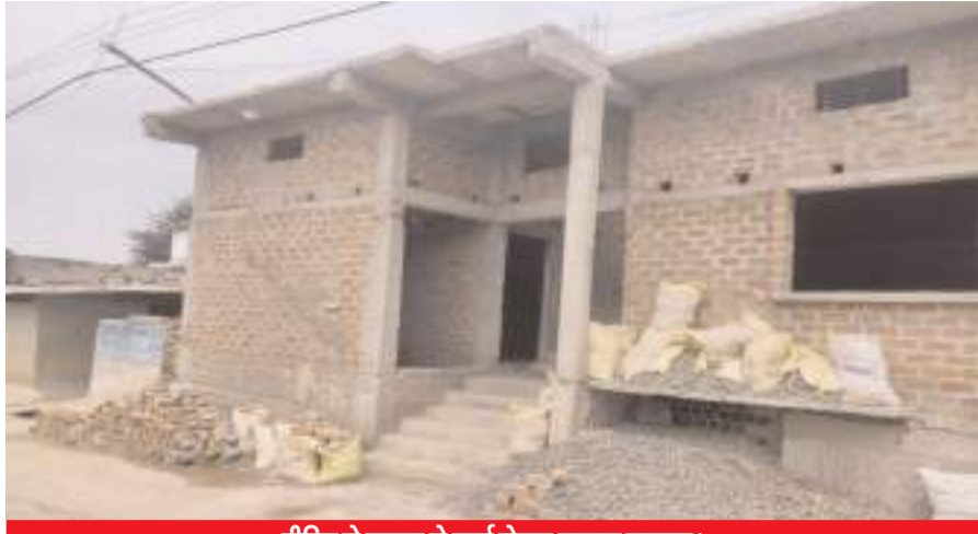
पीड़ित ने बाजार से कर्जा लेकर बनाया मकान।

माही की गूंज, राजगढ़ (ब्यावरा)। एक तरफ मध्य प्रदेश सरकार हर सम्भव गरीबों की मदद कर