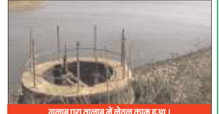
गुलाबपुरा तालाब में लेवल कम हुआ।