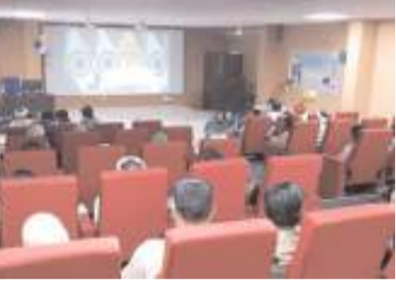
माही की गूंज, अलीराजपुर।

प्रधानमंत्री आवास योजना ग्रामीण के हितग्राहियों के गृह प्रवेश कार्यक्रम को प्रधानमंत्री नरेन्द्र मोदी एवं मुख्यमंत्री शिवराजसिंह चैहान ने संबोधित किया। अलीराजपुर जिले में उक्त संबोधन को वरुअल माध्यम से जिलेभर में सुना और देखा गया। प्रधानमंत्री मोदी ने हितग्राहियों को वरुअली गृह प्रवेश कराया। अलीराजपुर में जिला स्तरीय कार्यक्रम कलेक्टर टोटे आडिटोरियम में आयोजित हुआ, जिसमें हितग्राहियों ने प्रधानमंत्री श्री मोदी एवं मुख्यमंत्री श्री चैहान के संबोधन को सुना। अलीराजपुर जिले में 13 हजार 200 हितग्राहियों को प्रधानमंत्री आवास योजना के तहत निमित्त