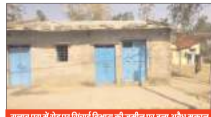
गुलाबपुरा में रोड पर सिंचाई विभाग की जमीन पर बना अवैध मकान