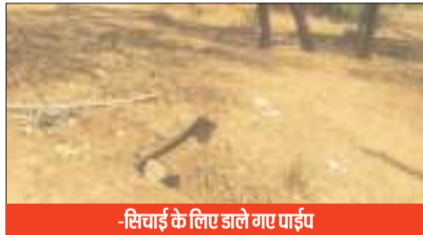
-सिंचाई के लिए डाले गए पाईप